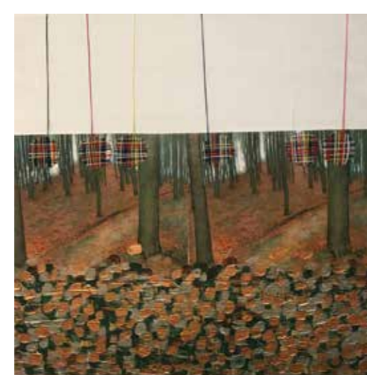
Maartje Blom (2 e prijs volwassenen)