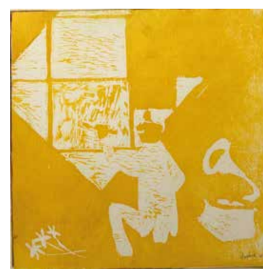
Daphne Vink (2 e prijs jeugd 12 t/m 18 jaar)