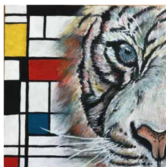
Liya Poyraz (1 e prijs volwassenen)