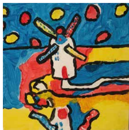
Gloria van Hoek (1 e prijs kinderen 4 t/m 11 jaar)